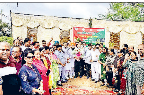
अंबाला। वन कार्यक्रम के तहत पौधरोपण करते भाजपा नेता व कार्यकर्ता।