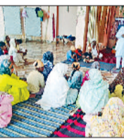
कार्यक्रमों का एक शेड्यूल तैयार