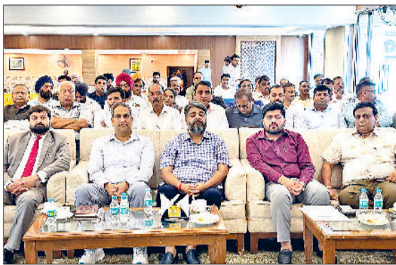
अंबाला। कार्यक्रम में मौजूद पूर्व राज्यमंत्री असीम गायल व अन्य।

एमएसएमई विभाग द्वारा शुक्रवार को किर्माफिशर पर्यटन स्थल में उद्यमियों के लिए एक वर्कशॉप का आयोजन किया गया। कार्यक्रम में मुख्य अतिथि के तौर पर पूर्व राज्यमंत्री असीम गायल नयौला व वशिष्ठ अतिथि के तौर पर उपायुक्त अजय सिंह ने शिरकत करते हुए दी प शि खा प्रज्वलित करके कार्यक्रम का शुभारंभ किया। इस अवसर पर उद्यमी औद्योगिक क्षेत्र में आगे बढ़ सकें इसके लिए एचईईपी पॉलिसी 2025 के तहत क्रियान्वित योजनाओं को प्रेजेंटेशन के माध्यम से प्रदर्शित किया गया। पूर्व राज्यमंत्री असीम गायल नयौला ने इस मौके पर एमएसएमई विभाग द्वारा यहां पर आयोजित वर्कशॉप की सराहना करते कहा कि उद्यमियों और एमएसएमई के बीच बेहतर समन्वय होना बेहद आवश्यक है ताकि उद्यमियों को विभाग द्वारा क्रियान्वित योजनाओं के बारे जानकारी मिल सके और उद्यमियों की जो भी समस्याएं हैं उनको