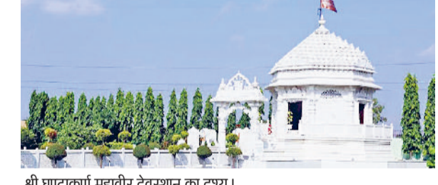
श्री घण्टाकर्ण महावीर देवस्थान का दृश्य।