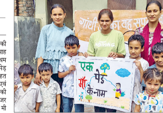
पानीपत। पर्यावरण को घना करने का संदेश देते हुए बालक।