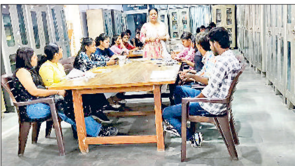
अंबाला। वेबिनार में हिस्सा लेते छात्र।