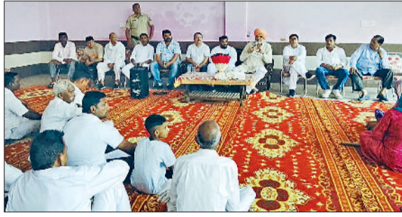
यमुनानगर। गांव अलाहर में आयोजित जनसंपर्क कार्यक्रम के दौरान ग्रामीणों को संबोधित करते हुए कृषि मंत्री श्याम सिंह राणा।

हरियाणा के कृषि एवं किसान कल्याण, मत्स्य और पशुपालन मंत्री श्याम सिंह राणा ने कहा कि प्रधानमंत्री नरेंद्र मोदी की कार्यशैली और सोच के कारण देश तेजी से आत्मनिर्भर भारत की दिशा में आगे बढ़ रहा है। उन्होंने कहा कि हर नागरिक को स्वदेशी वस्तुओं को अपनाना चाहिए ताकि भारत विदेशी वस्तुओं पर निर्भर न रहे। उन्होंने