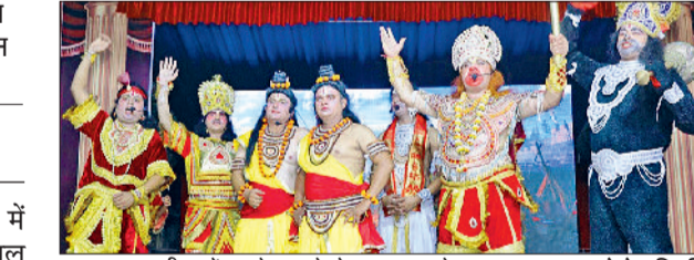
लाडवा। रामलीला में अपने-अपने रोल अदा करते कलाकार।

लाडवा की संगम मार्केट में सुगनी देवी स्कूल के सामने चल रही जय भारत कला मंच द्वारा आयोजित रामलीला में गत रात्रि रामायण के लक्ष्मण मूर्छा प्रसंग का एक भव्य और भावपूर्ण