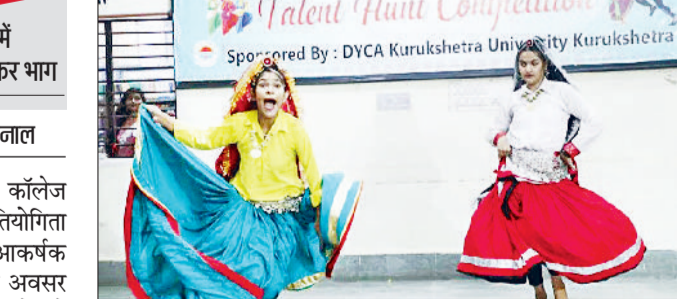
करनाल। प्रतियोगिता के दौरान नृत्य पेश करती हुई छात्राएं व उपस्थिति।