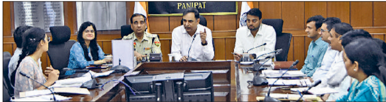
पानीपत। बैठक करते हुए प्रशासनिक व पुलिस अधिकारियों।

सरकार किसानों को पाराली प्रबंधन के लिए हर संभव साधन उपलब्ध करा रही