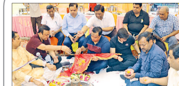
पानीपत। श्री देवी मंदिर में झंडा रसम पूजा करते अतिथिगण आदि।